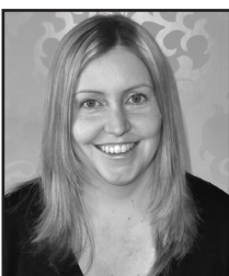
Petra Nåls Norra Djurgården/ Replot