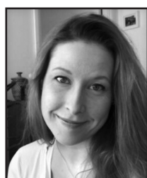
Kia Blom Stockholm/Pörtom