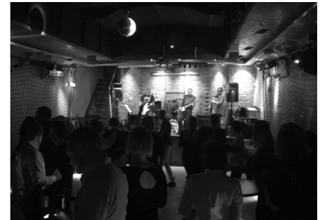
Festen höll på in på småtimmarna.

Sedan var det roligt att träffa nya människor som dessutom alla förstod björködialekt. Bara en sån sak. Och även en del gamla bekanta ansikten som jag inte sett på ett tag. Jag tyckte på det hela taget att det var lätt att känna sig hemma bland alla glada exil-österbottningar trots att jag inte kände de flesta från tidigare. Men det att vi kommer från samma ställe gör att vi har mycket gemensamt i vår bakgrund och kan snabbt hitta en