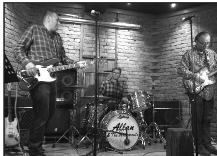
Allan & The Astronauts skötte om takten.