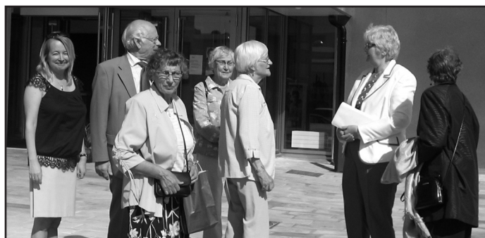
Text och foto Monica Skogman