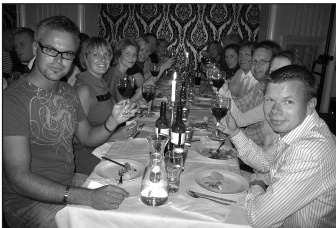
Text: Markus West

24 oktober visades dialektfilmerna eftersom vi var tvungna att ställa in filmvisningen den 7 november . Informationen om bytt datum kunde man läsa på hemsidan och på Facebook. Terese tackar för visat intresse.