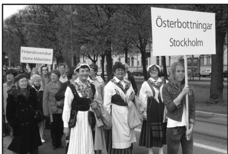
Parad till Skansen