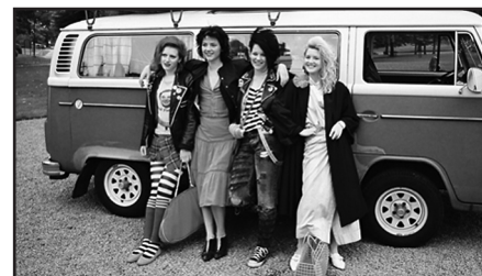
Från filmen Tjenare Kungen.

År 2005 gjorde Ulf Malmros film "Tjenare kungen" succé på biograferna. Filmen handlar om några tjejer som startade ett punkband i Göteborg 1984. Den öppnade 1980-talsvärlden för en ny publik, som gillade vad de såg. För oss som vill ha riktiga filmer, sådana som är gjorda på 1980-talet, är det bioklassiker som "Jakten på den försvunna skatten",