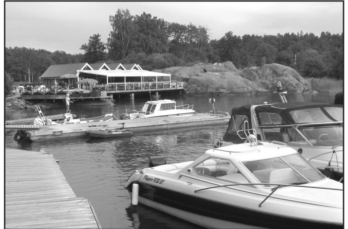
Båthamnen besöks av många båtägare. Restaurang Framfickan i bakgrunden.

Undrar just om de tycker att vi är som "Egyptens gräshoppor" när vi, turister, anländer till Grinda.